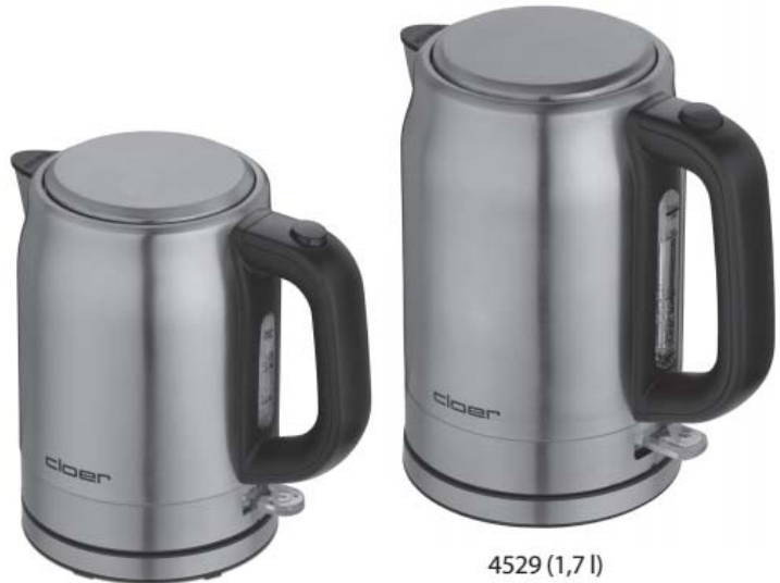
4519 (1 l)