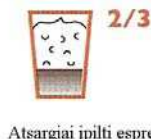
Atsargiai įpilti espresso kavos